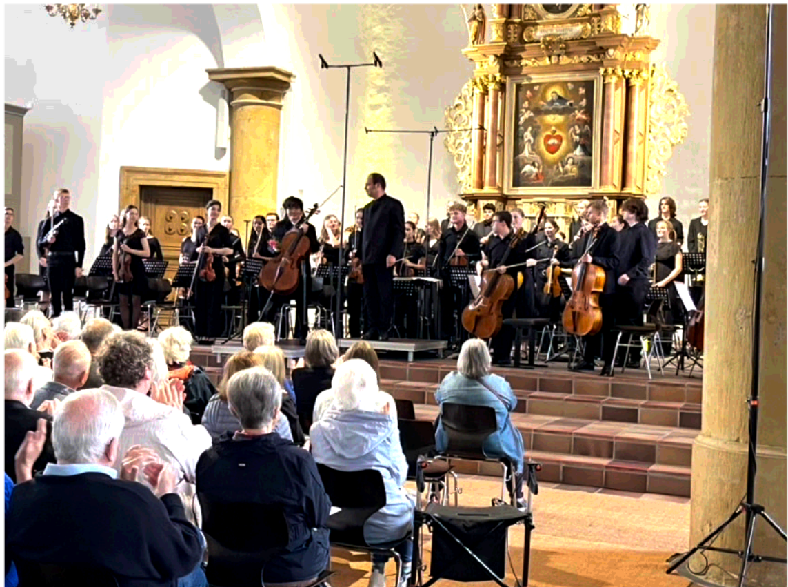
27 juli 2025, 11u: concert nr. 4 Hagen a.T.W. Ehemalige Kirche