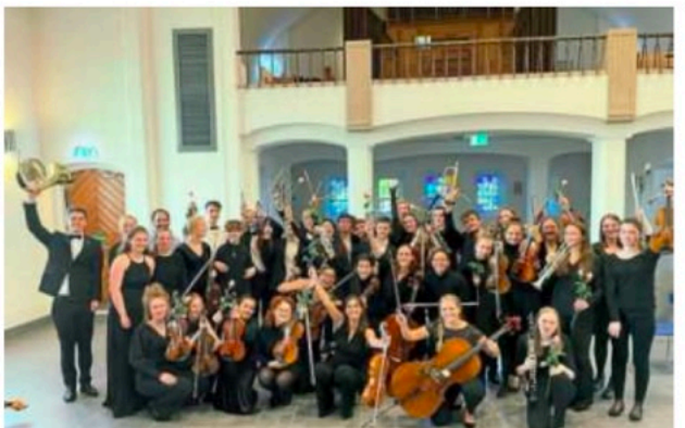
Die jungen Musiker des Euregio Academy Orchestras gastieren auch in Münster.