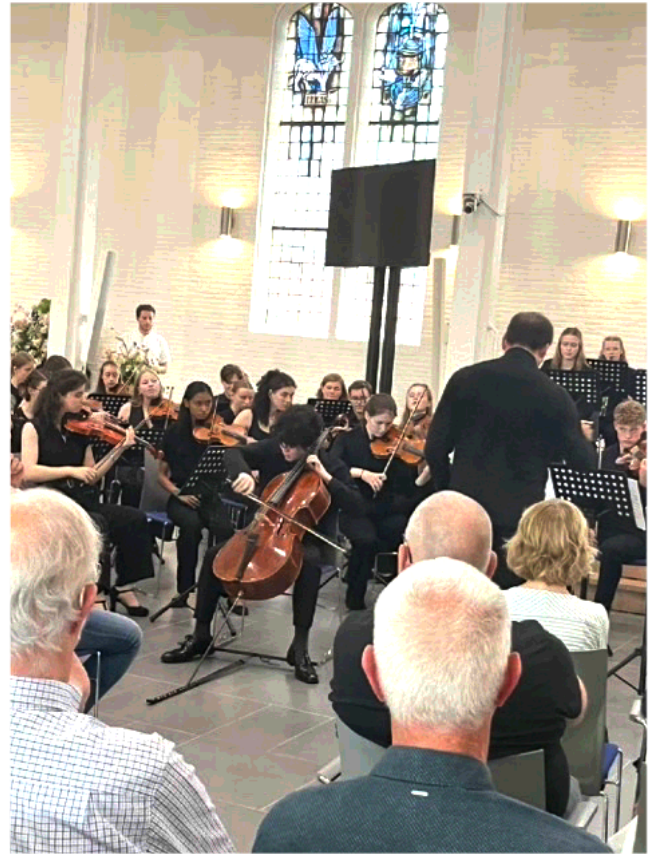
26 juli 2025, 15u30: concert nr. 3 Enschede Ontmoetingskerk, © Maria Montes