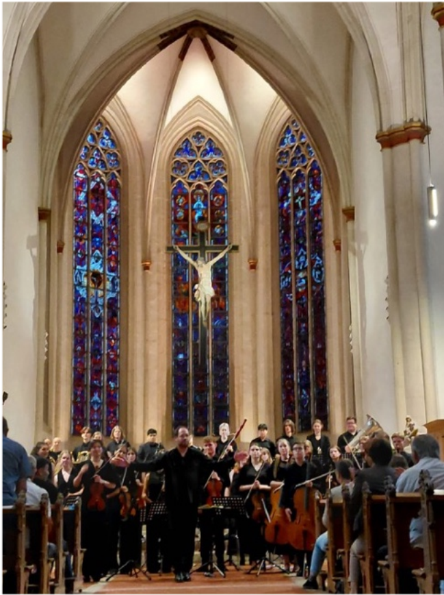
25 juli 2025, 19u: concert nr. 2 Münster, Überwasserkirche, © Maria Montes