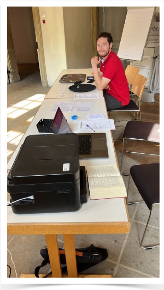
mentor Juan zit klaar voor ontvangst van de muzikanten

Na voorbereidingen in het najaar van 2024, het zoeken en vinden van sponsors en subsidiegevers, konden vanaf januari 2025 jonge getalenteerde muzikanten geworven worden. De sollicitatieprocedure via video-audities eindigde op 15 april, waarna voor een 10tal plekken in het orkest nog gericht verder gezocht werd.