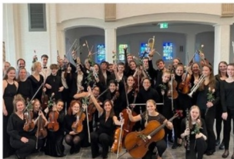
Het Euregio Academy Orchestra concerteert in de Ontmoetingskerk.

Ik zag hoeveel waardevolle culturele instellingen wegbezuinigd waren, hoeveel behoefte er is aan zingeving, maar ook dat er ondanks de Europese gedachte nog heel verschillende wereldwises heersen in de twee landen. Daaruit rijpte dus de idee om een projectorkest met jongeren te organiseren die elkaar kunnen verrijken vanuit hun eigen achtergrond en overtuigingen." - Hoe krijg je de spelers bij elkaar en wat heb jij ze te bieden? "Een half jaar voor aanvang van het project openen we de aanmeldingsprocedure. Jongeren die een klassiek orkestinstrument spelen, kunnen zich aanmelden met een video-opname van hun spel. Zo stellen we een orkest samen voor de muziek die we gaan spelen. Voor jonge talenten is samenspelen in orkestverband een ontzettend waardevolle en noodzakelijke aanvulling op hun individuele lessen. Daarnaast is het ook een indrukwekkende sociale ervaring die ze met elkaar hebben als ze samen op hoog niveau klassieke meesterwerken van Beethoven of Tchaikovsky spelen." - Waarom vind je het belangrijk om met jonge talenten te werken? "Vorige zomer is nog maar eens gebelden hoe fragiel de staat