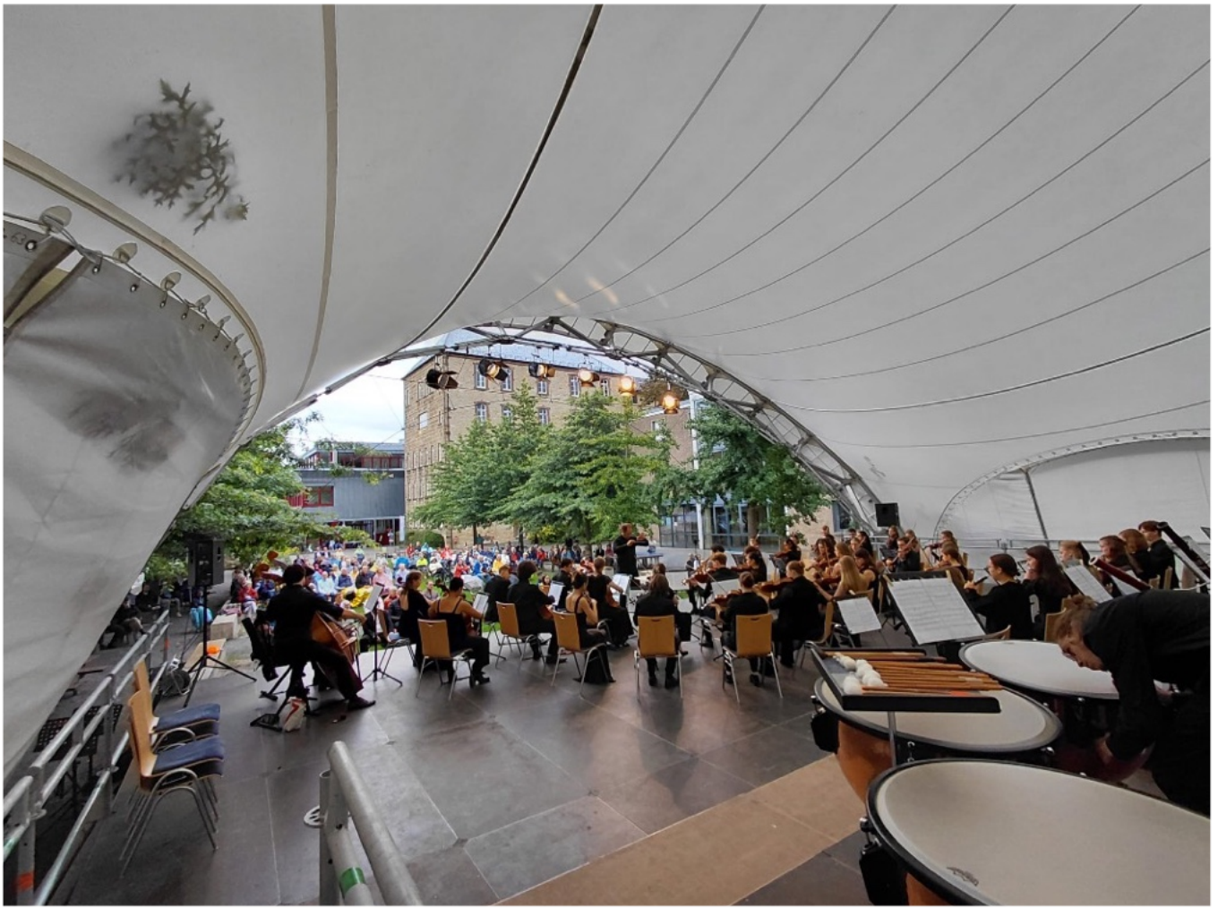
27 juli 2025, 17u: concert nr. 5 Osnabrück St. Angela Campus, © Juan David Alvarez Rodrigues