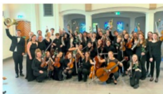
Junge Talente prägen das Euregio Academy Orchestra.

MÜNSTER. Eines von fünf Konzerten des Euregio Academy Orchestra spielen die 14 bis 20-Jahre-jungen wie talentierten Musikerinnen und Musiker aus Deutschland und den Niederlanden in Münster. Für den Auftritt am 25. Juli (Freitag) in der Liebfrauen-Überwasserkerche verlosen die WN jetzt Tickets.